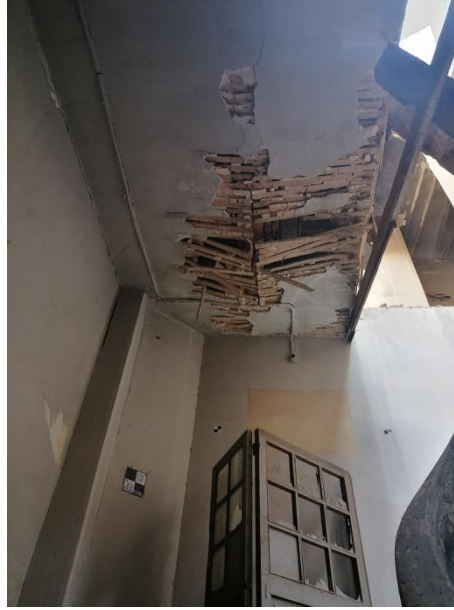
Η οροφή της κλίμακας του ισογείου