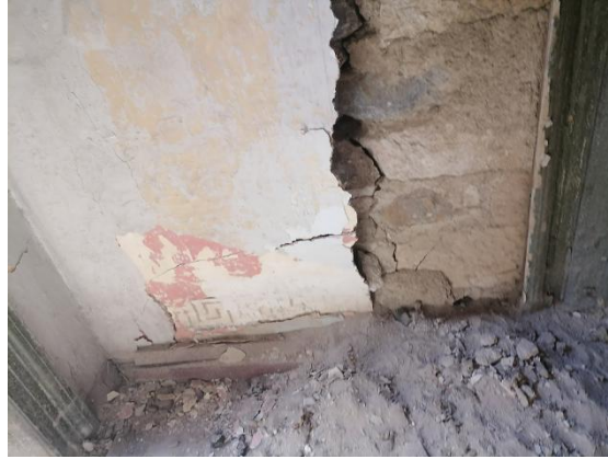
Χώρος ΙΣ.1.3.- Ο ζωγραφικός διάκοσμος που διασώζεται στο επίπεδο του πασαμέντου

Στους τοίχους του χώρου παρατηρούνται πολλές παρεμβάσεις, (προσθήκη παταριού και ραφιών στηριγμένα στον τοίχο, χρήση τμήματος του χώρου ως λουτρό, μεταλλικοί δοκοί για την ενίσχυση του δαπέδου της ανωδομής). Η κατάσταση διατήρησης του υποστρώματος του ζωγραφικού διακόσμου παρουσιάζει σημαντικά προβλήματα απωλειών, αποκολλήσεων, ρωγμών και τοπικών συμπληρώσεων. Επίσης, ο βόρειος τοίχος παρουσιάζει εντονότερα προβλήματα, αποσάθρωσης και αποκολλήσεων υποστρώματος λόγω της κατερχόμενης υγρασίας που πιθανόν γίνεται από τη στέγη, στη συναρμογή της προσθήκης του ορόφου (1888) με το αρχικό κτήριο. Στο δεξί τμήμα του χώρου διασώζεται ζωγραφικό στρώμα, στο επίπεδο του πασαμέντου το οποίο παρουσιάζει έντονες τάσεις αποκόλλησης από την τοιχοποιία. Σε αυτό το τμήμα προτείνεται η απόσπαση του και η επανατοποθέτηση μετά το πέρας των αναστηλωτικών επεμβάσεων.