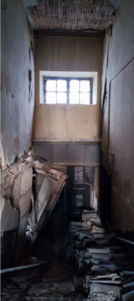
Χώρος ΙΣ. 1.1- Γενική άποψη του χώρου