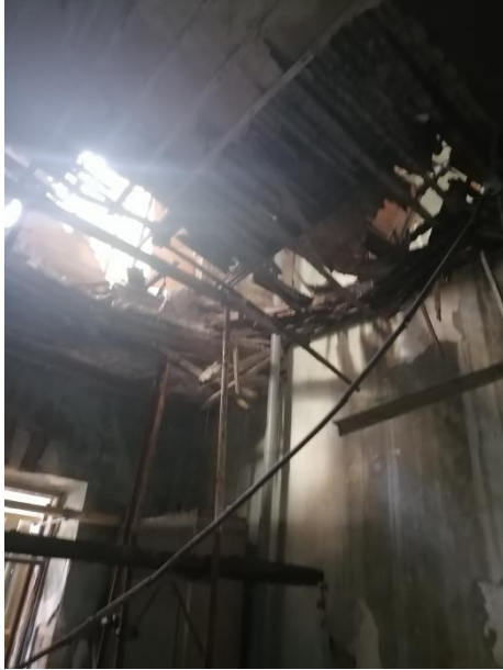
Η οροφή του χώρου που βρίσκεται αριστερά της εισόδου